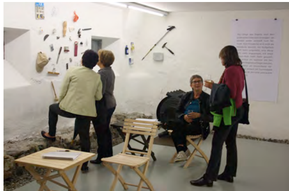
Besucher in der Ausstellung