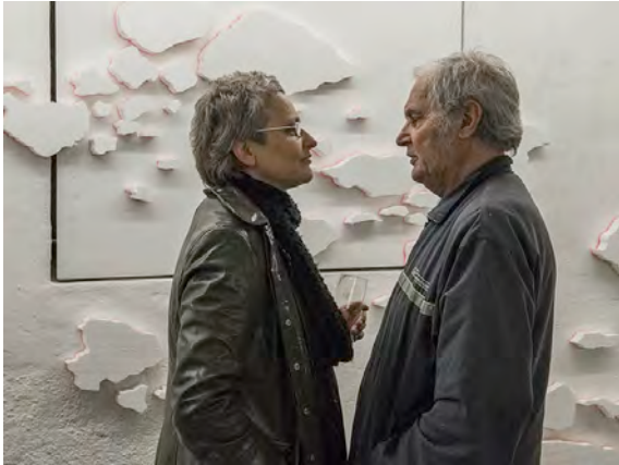
Vernissage „Bergseen“, 9.5.2014