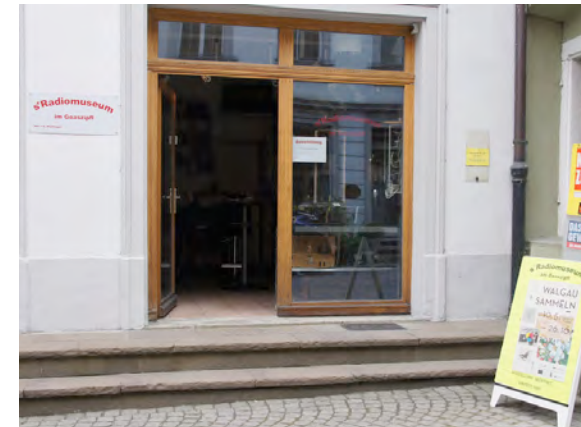
Tag der offenen Sammlungen, S' Radiomuseum Goaszipfel