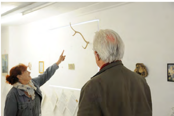
Workshop „Dinge erhören“, 27.4.2014