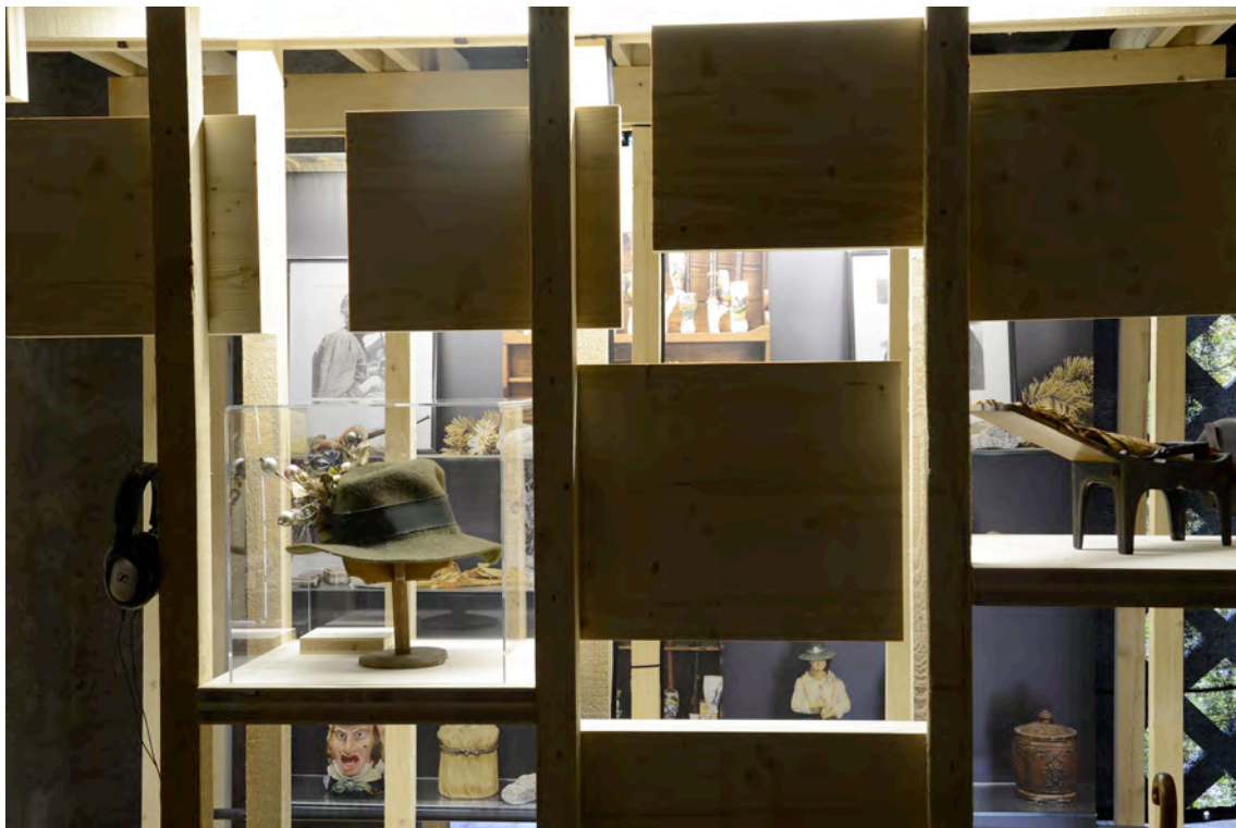
Ausstellungsbox in der Artenne, Tabakmuseum Frastanz, Foto: Sarah Schlatter, 2013