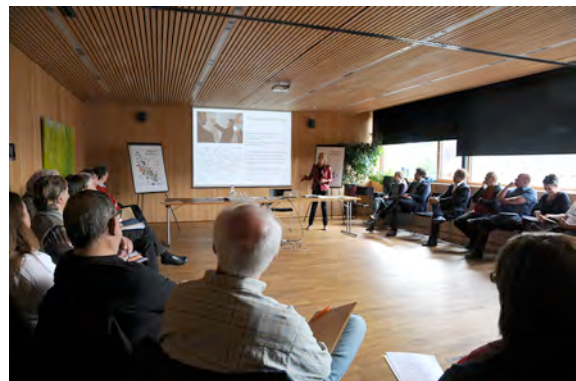
Symposium in Ludesch, 26.4.2014