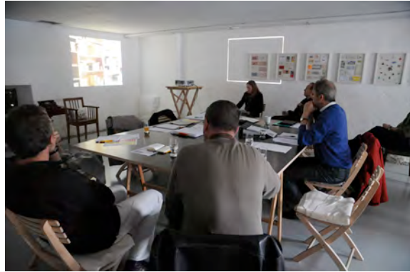
Arbeitsitzung mit Experten