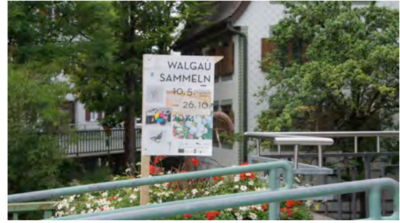
Tag der offenen Sammlungen, Wegweiser