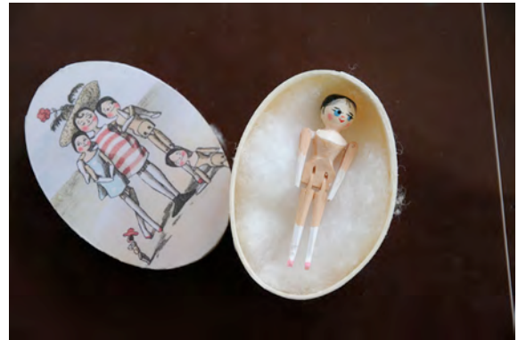
Ausstellungseröffnung „Typisch Walgau“, 4.9.2014