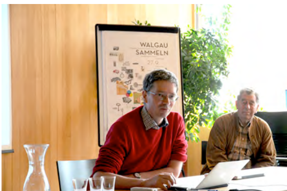
Symposium in Ludesch, 26.4.2014