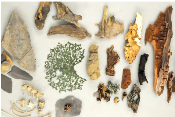
Objekte der Ausstellung „Berge. Schöne Landschaft“