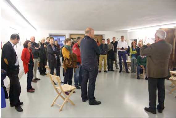
Eröffnung „Unerhörte Dinge“