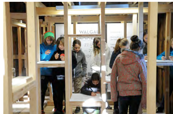
Workshop mit SchülerInnen in der Ausstellung