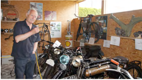
Tag der offenen Sammlungen, Motorradmuseum,