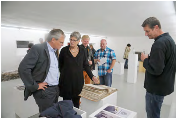
Ausstellungseröffnung „Typisch Walgau“, 4.9.2014