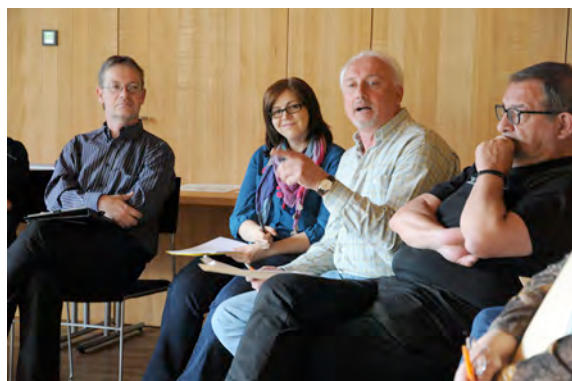
Symposium in Ludesch, 26.4.2014