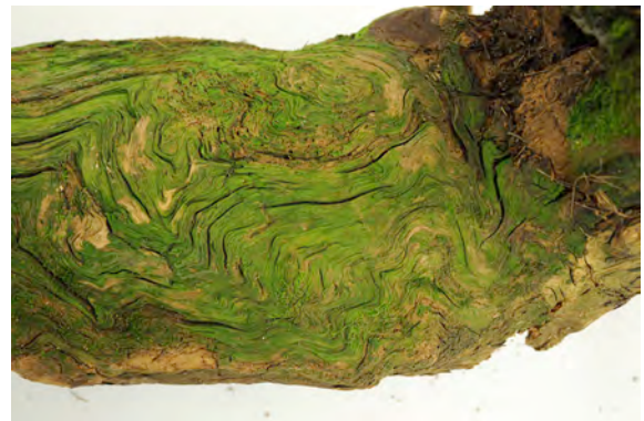
Objekt der Ausstellung „Berge. Schöne Landschaft“