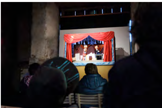
Lange Nacht der Museen, 4.10.2014