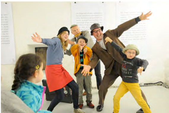
Lange Nacht der Museen