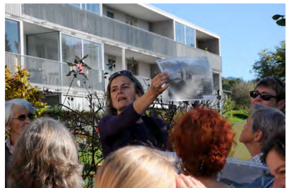
Die Fabrik im Dorf, 19.10.2014