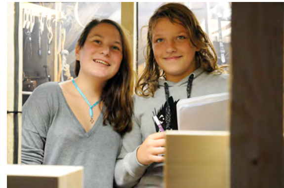
Workshop mit SchülerInnen in der Ausstellung