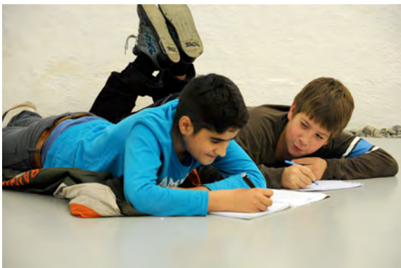
Workshop mit SchülerInnen in der Ausstellung