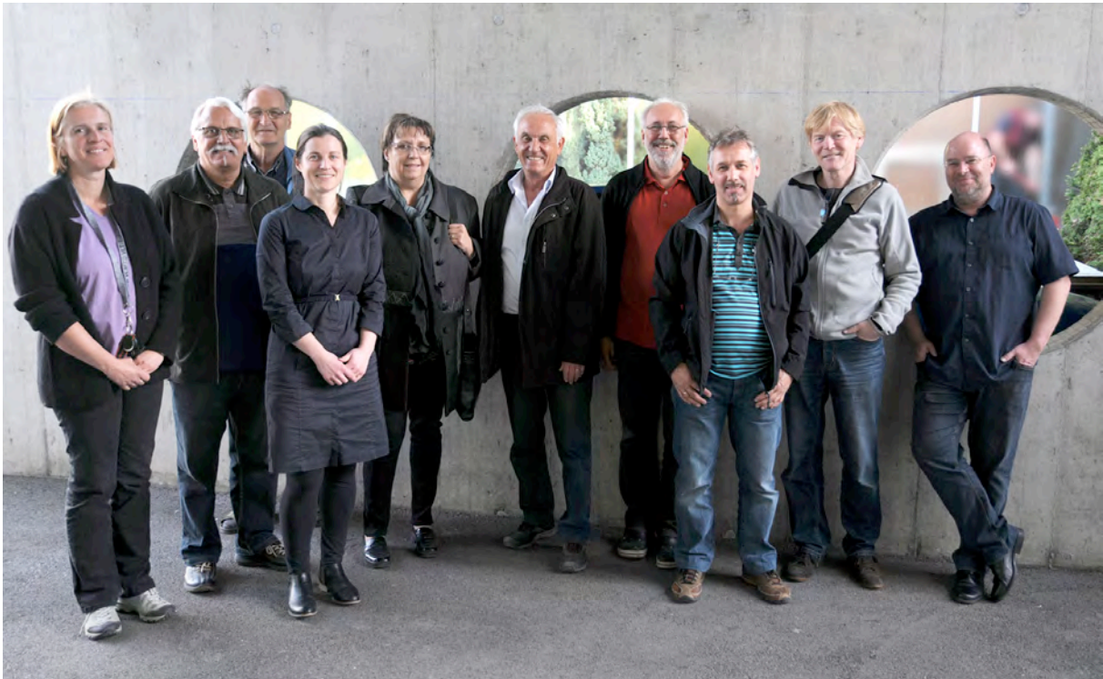
Depotbesichtigung im vorarlberg museum, 10.4.2014